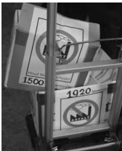
Dozen vol met protestkaarten onderweg naar het provinciebestuur in Assen