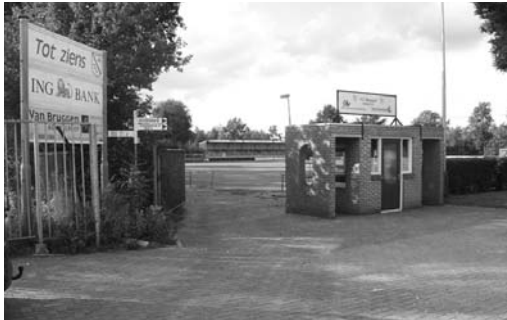
Het veld van FC Meppel ligt er zo te zien prachtig bij, maar er moet niet intensief op worden getraind.

Zouden de drie Ezinge-clubben niet meer samen kunnen werken? Sportief als ze zijn, doen ze dat natuurlijk al jaren. Maar een echt gebrek aan ruimte los je daarmee niet op. Een andere mogelijkheid zou kunnen zijn om één van de drie clubs te verhuizen en zo meer ruimte te creëren voor de overblijvende clubs. Maar de makkelijkste