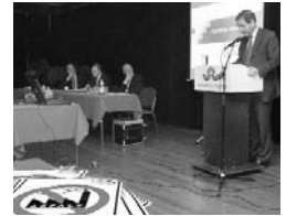
Ook het Meppelse bedrijfsleven sluit zich aan bij de protesten tegen de asfaltcentrale

nen dat het na deze correctie niet meer met zekerheid is te zeggen of er geen overschrijding van de normen gaat plaatsvinden. Op 6 april houdt de provincie in Meppel een informatieavond over de conceptvergunning en het RIVM-rapport. De opsteller van het rapport erkent dat Meppel op het randje zit van wat toelaatbaar is.