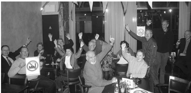
Veel gejuich bij de actiegroep 'Houd Meppel Schoon!' en sympathisanten die het succes kwamen meevieren.

Maar ja, hoe gaat zoiets? Wat weet het zwaarst bij de rechter? En kun je als kleine mensen wel op tegen instanties (gemeente en provincie) en het grootkapitaal (Heijmans)? Maar gelukkig werd de actiegroep