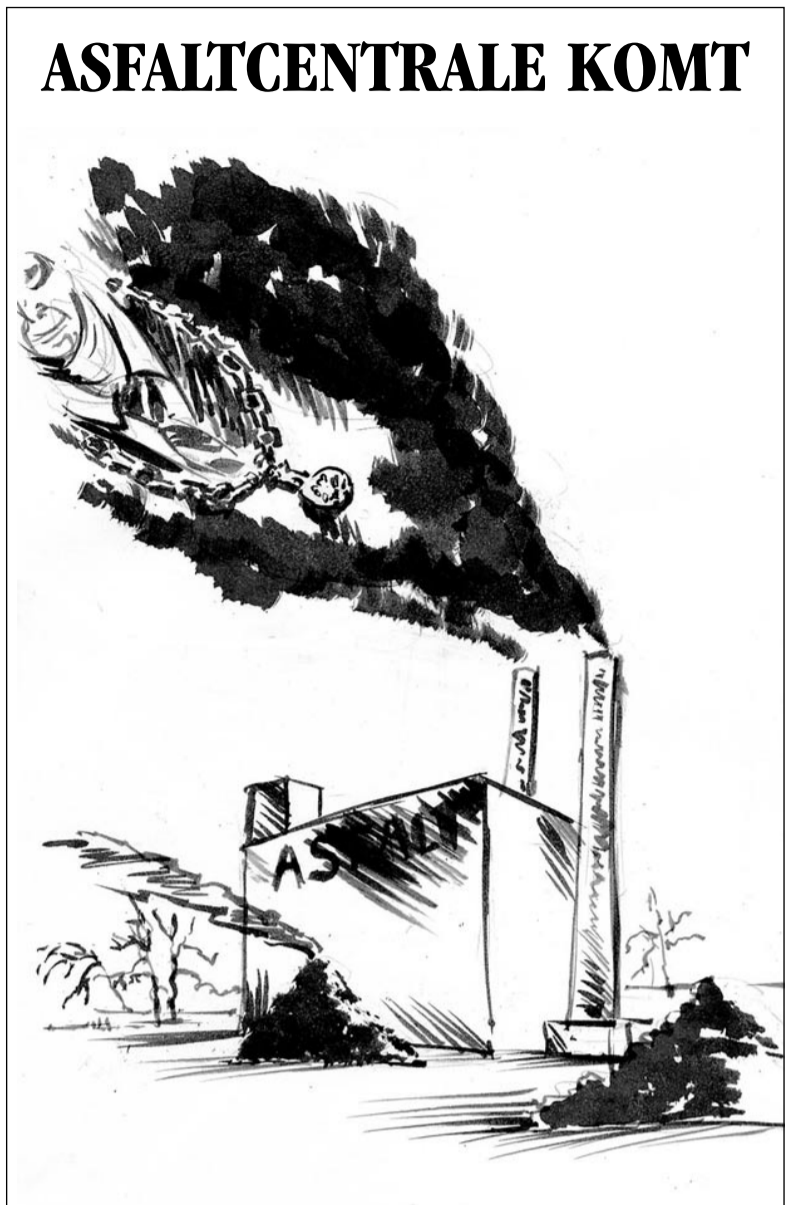
Megadampen over de stad

Is de wethouder tot andere gedachten gekomen of is het toeval? Opmerkelijk is dat voordat hij met de resultaten van een belofde evaluatie naar buiten kwam, hij met een proef begonnen is in de Oosterboer. Hier wordt het onkruid op dit moment te lijf gegaan met heet water. Sterk Meppel had dat bij de behandeling in de raad destijds ook bepleit, maar dat werd toen afgedaan als niet haalbaar. Het kan verkeren.