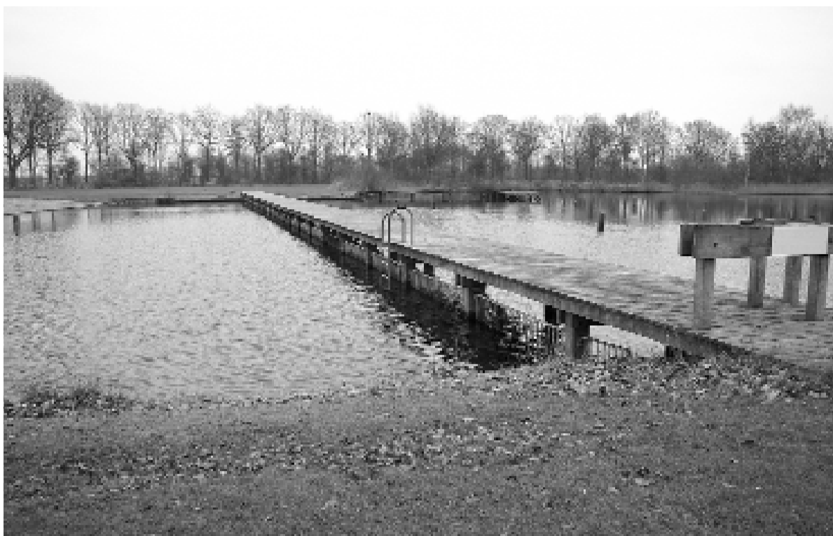
De steiger scheidt het diepe gedeelte van het ondiepe. Dat komt de veiligheid ten goede: kleine kinderen kunnen daardoor niet zomaar in het diepe deel komen.

Na overleg met de dorpsvereniging heeft het college het besluit ingetrokken en blijft de steiger bestaan. Precies wat de inwoners willen.