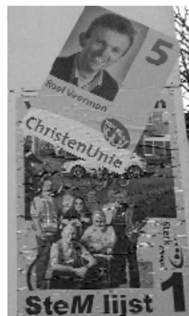
De ChristenUnie zoekt al voor de verkiezingen toenadering.

Inspreker in de raadsvergadering: 'En het hielp eigenlijk geen nix.'