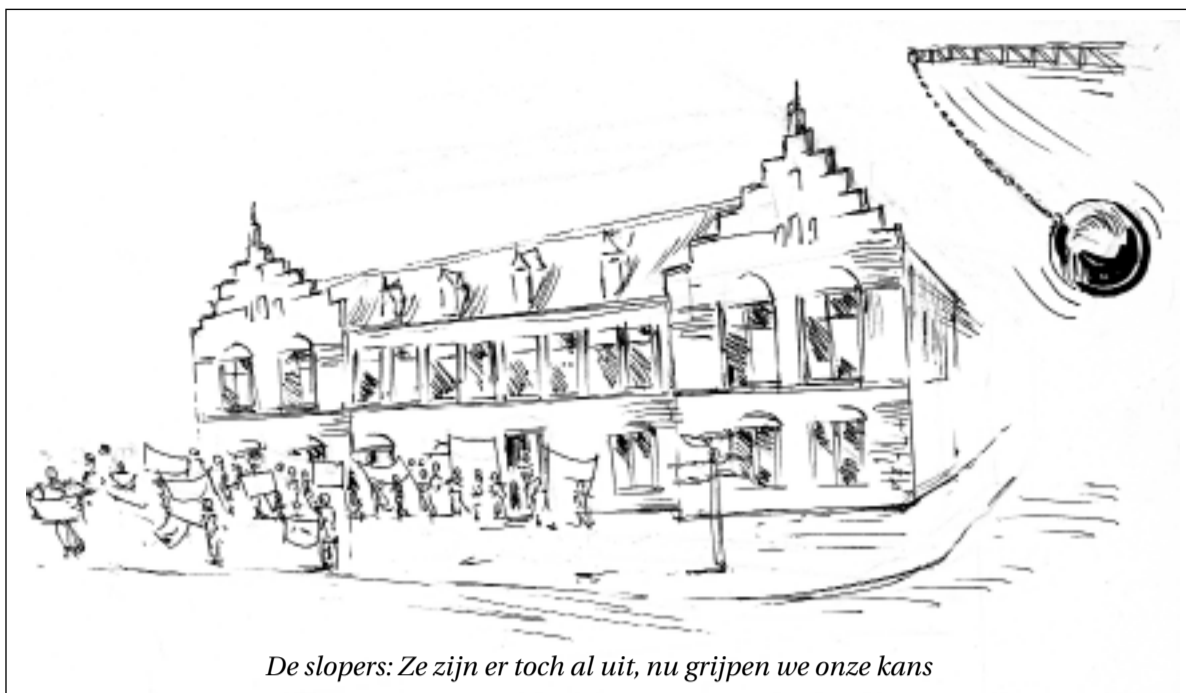
De slopers: Ze zijn er toch al uit, nu grijpen we onze kans