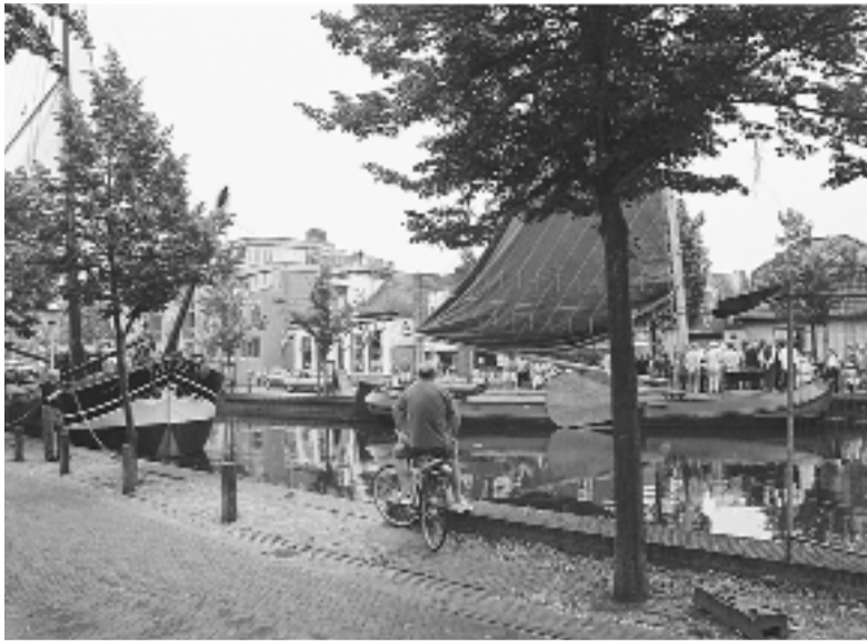
Vaker historische schepen terugbrengen in de grachten. Dat is één van de ideeën van de speciaal opgerichte raadscommissie.

Ook binnen de gemeenteraad groeide bij alle partijen het besef dat er meer met de grachten gedaan moet worden. Op initiatief van de PvdA werd een commissie in het leven geroepen die als doel heeft de te onderzoeken wat er mogelijk is. Alle partijen maken deel uit van deze commissie, die werd aangevuld met een aantal deskundigen op het gebied van oude beroepsvaartuigen en evenementen. Eén van de ideeën van de commissie is historische schepen terug-