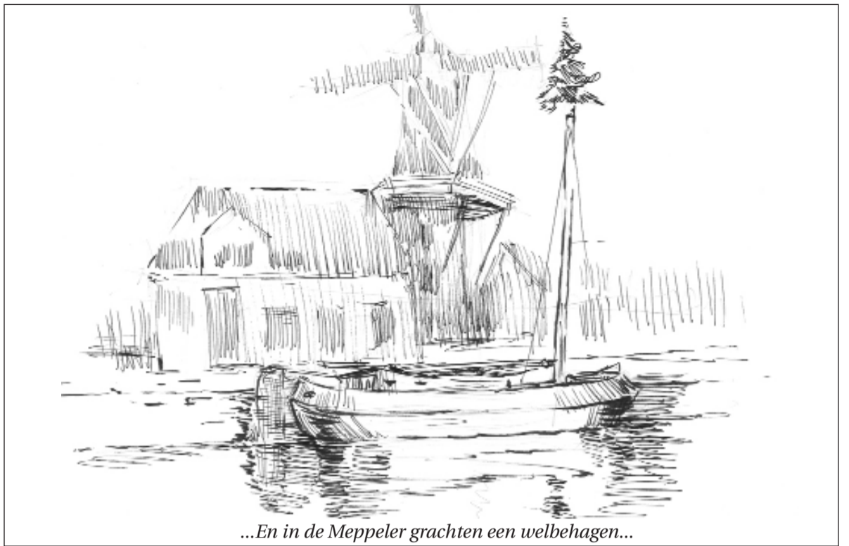
...En in de Meppeler grachten een welbehagen...