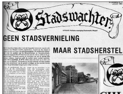
Een trits oude voorpagina's, waaruit blijkt hoezeer de krant altijd op het vinkentouw zat (en zit) voor een mooie stad, volksgezondheid en woongenot. In de jaren tachtig waren er ook al problemen op de Randweg (zie knipsel rechts).