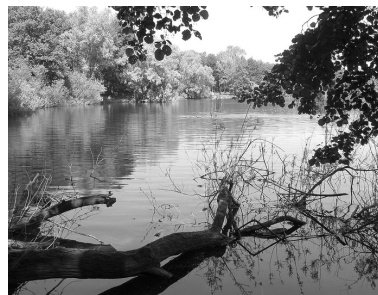
Een prachtig recreatiebos, waar generaties na ons zeker nog veel plezier aan zullen beleven.

Het gebied is voor iedereen gratis toegankelijk om te fietsen, te zwemmen of te zonnen en voorziet zeker bij mooi weer in een behoefte. Dit geldt ook voor vissers en zeker voor duikers die gebruik maken van deze plas.