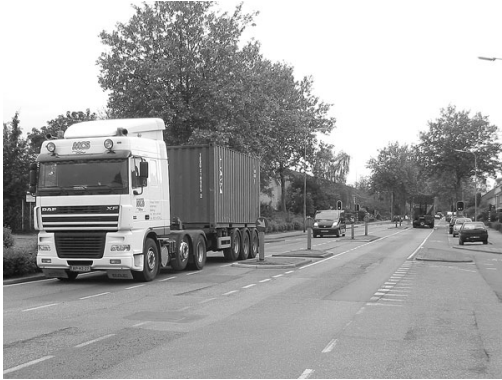
Het wegdek is slecht, putten verzakken en worden gedeeltelijk met asfalt opgevuld. Een lappendeken met scheuren en veel reparaties. Geen mooi wegdek, wel een drukke weg. Zelfs op rustige momenten, zoals hier, zie (en hoor!) je steeds vrachtwagens voorbij denderen.

De toenmalige wethouder Lanjouw (VVD) zegde toe binnen een maand met een notitie te komen. Dat werd later. De resultaten van het onderzoek waren dermate mager dat de commissie vrijwel unaniem het advies van het (demonstratieve) college een zware onvoldoende gaf. Alleen de onmogelijkheden werden benoemd. Dat pikte de commissie niet. Het CDA kondigde aan met een ini-