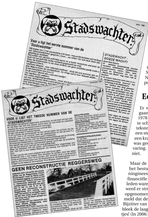
De eerste en de tweede uitgave van de Stadswachter op een A4-tje. Na drie jaar lag ie dan eindelijk op de mat!

En laten we eens uit eigen werk citeren. Uit de Stadswachter van oktober 1984: 'Wethouder H.J. van de Veen liet kortgeleden nog weten dat de subsidiekansen stijgen. Dat moet ook want het hele complex van stadsvernieuwing valt of staat eigenlijk met het realiseren van de brugverbinding over het Meppeler Diep. Het grootste voordeel is dat dankzij die brug het industrieverkeer uit de binnenstad geweerd kan worden. Het kwetsbare centrum wordt verlost van het zware verkeer dat straks via de Randweg of 'om de Noord' (RW 32, Tweeloo en de S10, de Bremenbergring richting Zwartsluis) kan rijden. De noordelijke route is favoriet. Meppel schiet er weinig mee op wanneer de Randweg extra belast zou worden. Het streven is juist om ook deze weg te ontlasten van het industrieverkeer.' Een jaar later kopte de Stadswachter zelfs: 'Randweg moet van vrachtverkeer af' . Als je zo iets in 2006 terugleest, dan krijg je het schaamrood op de kaken. Na 21 jaar nog steeds geen vooruitgang! Sterker nog: het probleem is alleen maar erger geworden.