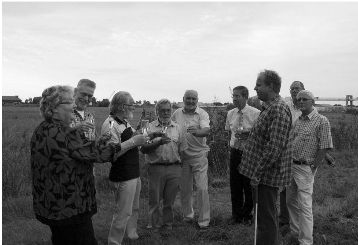
De fles Bruisend Meppel is open. De werkgroep Houd Meppel Schoon! viert het succes op de plek waar de asfaltfabriek uiteindelijk niet komt.

Dit alles lokte nogal wat weerstand bij de andere politieke partijen. De toenmalige burgemeester beschuldigde ons zelfs van stemmingmakerij. Daarover waren wij niet verbaasd. Dat hadden we bij vroegere acties ook al meegemaakt. Onder de Meppeler bevolking en bij ondernemers van de gevestigde industrie kregen wij wél brede steun. SteM was actief betrokken bij de oprichting van de actiegroep Houd Meppel Schoon! (HMS) en steunde op alle mogelijke manieren de acties van de groep.