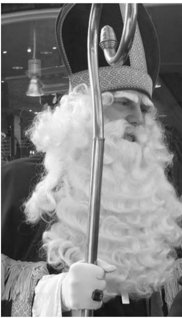
Naam: Sint Nicolaas Leeftijd: wel heel erg oud

In elk nummer ontlocken we een jongere en een oudere Meppeler een opinie over een actueel onderwerp. Bij deze aflevering 11. Moeten gedane belofes in de gemeenteraad altijd nagekomen worden?