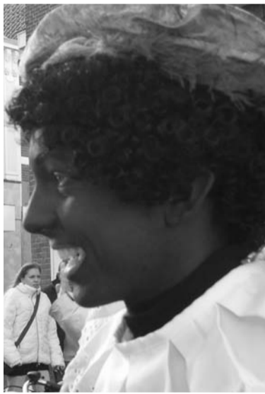
Naam: Zwarte Piet Leeftijd: 14 jaar

Jazeker, als je iets belooft moet je dat ook doen. Ik kijk dan altijd naar mijzelf. Stel je voor dat ik geen cadeautje in de schoen zou stoppen bij een lief kindje waaraan ik het beloofd heb, dat zou een ramp zijn. Kijk, natuurlijk kan er overmacht zijn, bijvoorbeeld als mijn paard uit zou glijden op het dak, maar dan nog zorg ik ervoor dat mijn pieten mijn belofes voor mij nakomen.