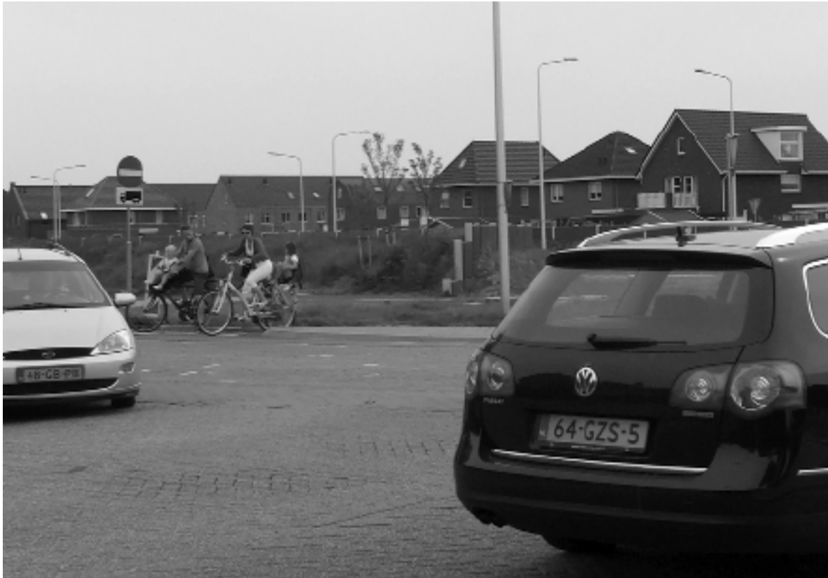
De rotonde in de Europalaan bij het kruispunt Rembrandtlaan/Randweg is echt een knelpunt. Het is daar een zeer onoverzichtelijke situatie, waar fietsers behoorlijk in de knel komen.

De enige oplossing van dit knelpunt is een geheel vrij liggende fietsverbinding. De aanwezigen waren verbaasd dat op dit drukke punt geen ongelijkvloerse kruising gecreëerd is, terwijl dat op twee andere plekken in de Europalaan wel het geval is (het tunneltje Westerstouwe en de fietsbrug bij Intra-tuin). Op de Valeriaan werd de groep opgewacht door een flink aantal bewoners, die de situatie daar met de SteM-delegatie bespraken. Deze bewoners klaagden over toezeggingen die niet nagekomen waren. Ze