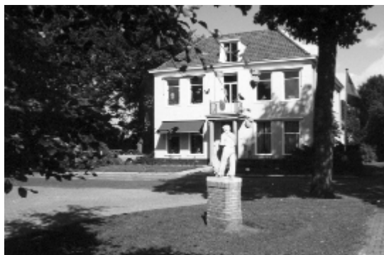
Het voormalige gemeentehuis in Nijeveen met De Zaaier ervoor. Een combinatie die gelukkig in ere wordt hersteld