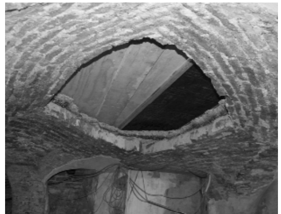
Het gewelf is gesloopt