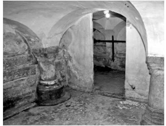
Zoals het was...

Het gewelf is nu deels gesloopt, maar de aannemer heeft gelukkig de zuilen wel laten staan. Vanuit de winkel is er straks de mogelijkheid om door glazen platen in de verlichte kelder te kijken. Maar dat hier onherstelbare schade is aangebracht aan een historisch unicum zal voor generaties na ons onbegrijpelijk zijn.