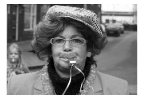
Wordt het weer een roze betoging, zoals in juni?

Daar komt bij dat de bewoners ontevreden zijn over de uitwerking van de herinrichting. De inrichting van de straten is zo krap dat de wijk moeilijk bereikbaar is voor de brandweer. De bewoners vrezen schade aan hun auto's als de brandweer snel moet ingrijpen, er zijn al auto's beschadigd. Ze vragen zich af wie er voor de schade opdraait.