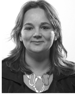
waar hun potentiële werknemers op afkomen.

Andere studies wijzen bovendien uit dat vooral mensen met een hogere opleiding willen wonen in steden met een gevarieerd cultureel aanbod. Bedrijven kunnen in hun vestigingsgedrag anticiperen op een woonklimaat in een stad