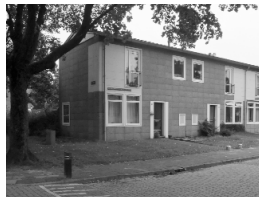
De Airey-woningen, begin jaren vijftig gebouwd, zijn nu zeldzaam

Meppel staat geheel achter het idee dat deze juweeltjes van oorspronkelijke woningen behouden moeten blijven.