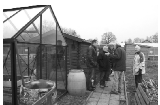
Tuinders die zich niet aan de regels houden, worden daarop aangesproken.

Als dit bestemmingsplan zo doorgaat, mogen er op dit complex geen schuurtjes en kassen meer gebouwd worden. Deze bepaling moet verrommeling tegengaan. Een rondgang over het terrein leerde dat het tegendeel het geval kan zijn. Juist bij mensen die het gereedschap in kisten opbergen zie je allerlei voorwerpen die anders in het schuurtje opgeborgen worden. Het bestuur van de vereniging is zich er terdege van bewust dat het complex een net aanzien moet hebben. Het bekipt of het reglement waarin het een en ander geregeld is verscherpt kan worden.