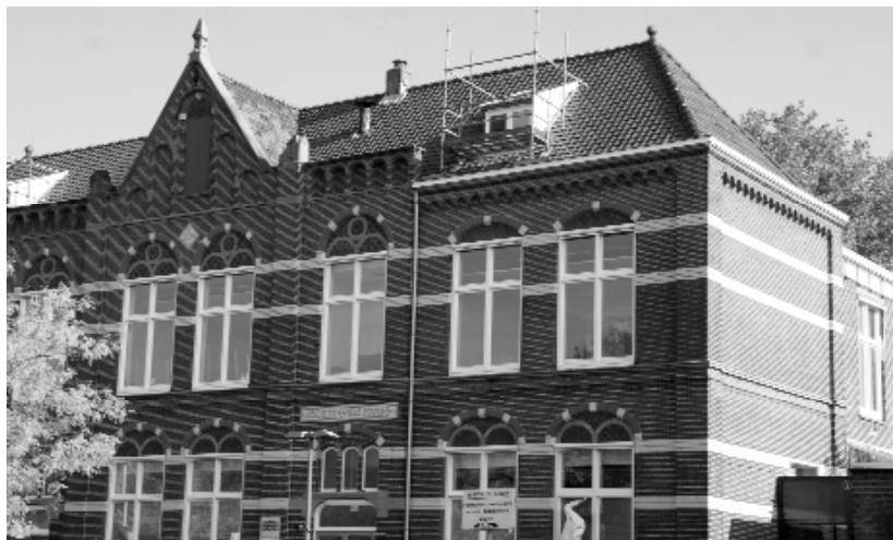
Komt er weer een basisschool, de Mgr. Niermanschool ditmaal, in het prachtige gebouw De Plataan, de vroegere Vledderschool?

Zo moet er gekeken worden naar de technische haalbaarheid. Ook de beheerstructuur moet kritisch onder de loep genomen worden. En natuurlijk moeten alle partijen zowel een eigen als een gezamenlijke visie ontwikkelen hoe ze het maximale uit de samenwerking kunnen halen. Als alles meezit, iedereen constructief meedenkt en de raad positief beslist, zou de Niermanschool 1 september 2012 op de nieuwe plek kunnen beginnen.