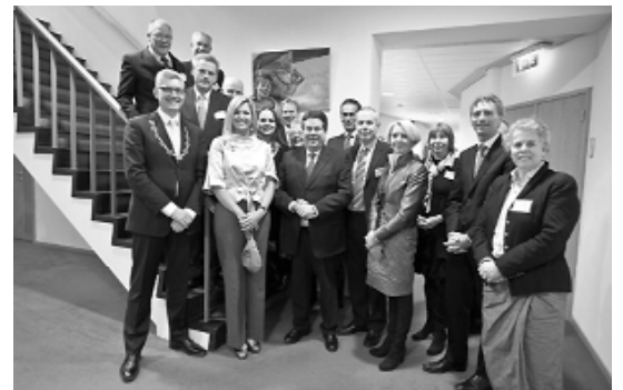
Prinses Máxima, omringd door regionale politici, in Valthermond

Onze wethouder is druk bezig met het zoeken naar bezuinigingsmogelijkheden. Daar zal nog behoorlijk wat onrust over ontstaan de komende tijd. En terecht! Want, zoals Sterk Meppel in het verkiezingsprogramma op de laatste bladzijde al aankondigde: het gaat pijn doen! En ook binnen de portefeuille van onze wethouder zullen klappen