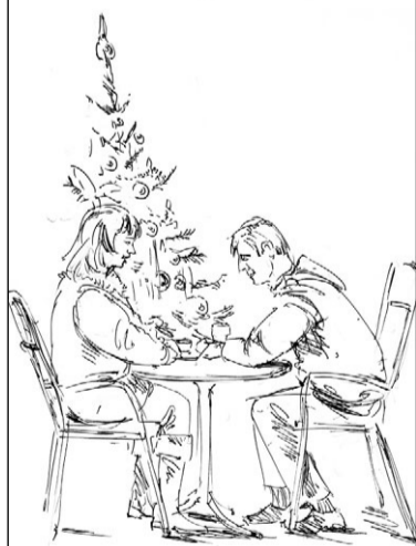
Misschien dat die student naast de kerstboom ook gaat delen in de feestvreugde