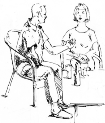
Dan betrekken wij toch een appartement in De Plataan?