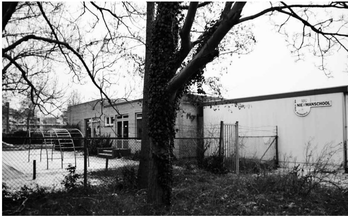
Het gebouw van de Mgr. Niermanschool wacht gelaten totdat het wordt vervangen door een complex huurwoningen

Maar de financiële onderbouwing van de verschillende mogelijkheden kwam niet goed uit de verf. De werkvergadering werd daarom afgesloten met een opdracht voor