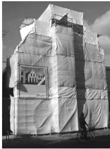
Het pand aan de Kruisstraat nu (boven) en voorheen.

Onlangs konden we even een kijkje nemen in het pand. De eigenaar en zijn vrouw lieten zien dat er veel aandacht wordt besteed aan oude bouwelementen. Zo worden de oude gipsreliëfplafonds helemaal gerestaureerd en blijven de prachtige oude balken in zicht. Het is in ieder geval wel geweldig te zien dat deze mensen in de huidige tijd zo'n grote klus op-