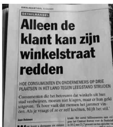
Elsevier, 23 februari 2013

Er komt een vicieuze cirkel op gang, want er ontstaan lege panden die niet meer gevuld worden. Een halflage winkelstraat heeft iets triests. Dan gaat de consument liever naar een andere locatie. Gelukkig gaat het in Meppel nog steeds goed: onze winkelpanden zijn grotendeels gevuld. Sterker nog,