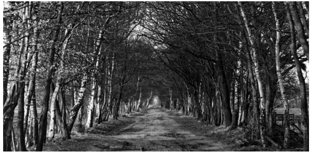
... maar zo zag de Ketelhaarsweg er winter 1999 uit (lageresolutiefoto, archief Oud Meppel)

Sterk Meppel zet zich altijd in om de cultuurhistorische waarden op alle terreinen in onze gemeente te beschermen. Bij de annexatie van het deel van Staphorst waar de wijk Berggierslanden was gepland kreeg Meppel er twee prachtige zandwegen bij, de Ketelhaarsweg en het laatste deel van de Westerstouwe. Hoewel het bestemmingsplan de cultuurhistorische waarde van deze wegen erkent is er weinig van overgebleven. Met het onlangs asfalteren van de Ketelhaarsweg is het laatste restje ook om zeep gebracht. De reactie van B&W op vragen van Sterk Meppel was verbijsterend.