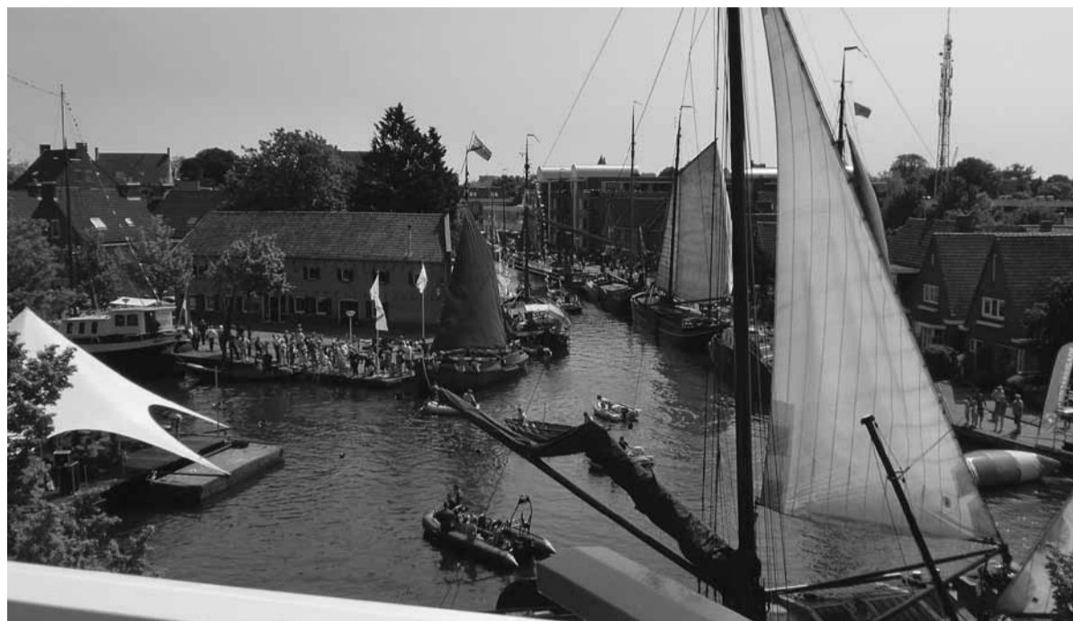
Het hart van het Grachtenfestival, met links het drijvend podium aan Bleekerseiland.

nair, de Donderdag Meppeldagen, Urban Unity Playground (door Scala georganiseerde zomeractiviteit op het gebied van 'urban culture', waarin jongeren gratis kennis kunnen maken met de kunstvormen), de Wandeling van Gedichten en Picknick in the Park XL? Zo kunnen wij nog wel even doorgaan, maar alles is ook te vinden in het kleine UitMeppel-magazine dat speciaal samengesteld is voor de Culturele Gemeente en natuurlijk op de website www.meppelmaakt.nl Sterk Meppel is trots op alle inzet die de vele vrijwilligers laten zien. Al deze activiteiten kunnen alleen maar plaatsvinden door dit enthousiasme en door de kracht van samenwerking. Juist in deze economisch moeilijker tijd is dat de grootste kracht die wij hebben.