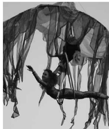
Vlinderachtige acrobatiek vormde een mooie start van het Cultureel Jaar

Volgens het reglement stemt de gemeenteraad de volgende raadsvergadering opnieuw, omdat ze niet compleet was. Nu maar hopen dat iedereen er dan is. Want hoe amusant de verrassing en de daaropvolgende verwarring ook was: het gaat hier om een van die onderwerpen die je niet politiek hoort te maken. Bovendien is het erg ondemocratisch gedrag als er zo'n ruime meerderheid is die het anders wil doen en wel uw portemonnee wil sparen.