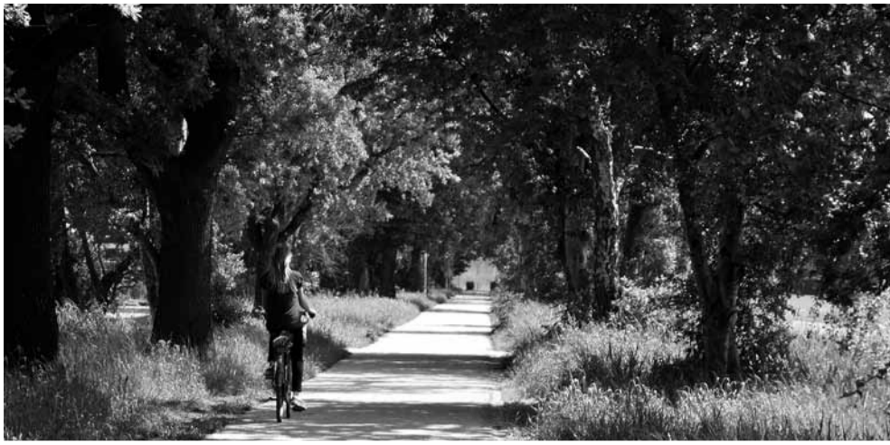
Best een aardig fietspad nu, daar gaat het niet om...