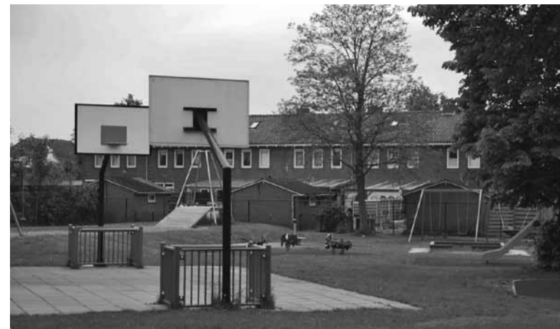
Het speel/sportterrein van 't Meugien.