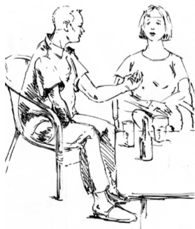
Die dachten: we verven die Ketelhaarsweg SteMgeel, dan trappen ze d'r wel in!