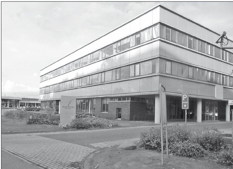
Het hoofdkantoor van Reest en Wieden komt binnenkort leeg te staan.