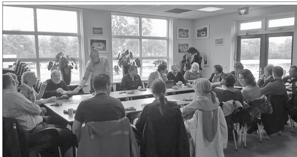
De raad op bezoek bij SVN '69

Tijdens de renovatie van het winkelcentrum in Nijeveen kwam er een grote partij straatstenen vrij. Omdat de parkeerplaats bij de sportvelden regelmatig een modderpoel is heeft het bestuur van de voetbalvereniging SVN'69 contact opgenomen met de gemeente en gevraagd of zij deze stenen mocht gebruiken voor het verbeteren van de parkeerplaats. Het bestraten zou dan door vrijwilligers gebeuren.