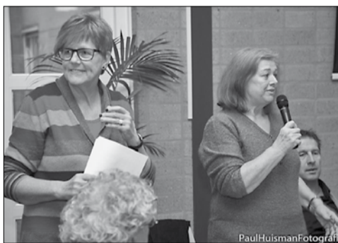
Boven: Onrust bij Reestmond brengt veel medewerkers in beweging.

Bij Reestmond werken mensen met een verstandelijke beperking. Hier vinden ze structuur in hun leven. Ze krijgen erkenning voor wat ze kunnen en zelfrespect door wat ze maken. Deze mensen konden en kunnen vanwege hun beperking niet bij een gewone werkgever aan de slag. Na vele jaren op een wachtlijst, zijn ze met een tijdelijk contract aan het werk gekomen. Maar het Rijk wil dat mensen met een arbeidshandicap bij een gewone werkgever geplaatst worden en staat niet toe dat er nieuwe mensen geplaatst worden. De mensen met een tijdelijk contract mogen wel nog een vaste aanstelling krijgen omdat ze er al werken. Het bestuur van Reestmond heeft echter besloten om dat niet te doen. Een opmerkelijke beslissing, want uit menig