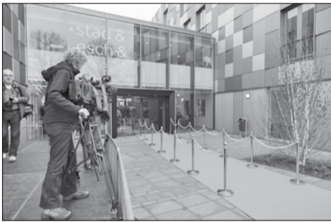
Boven: De loper uit voor Willem-Alexander Onder: De officiële opening, Rechts: Vertrek

Er heerste een ontspannen sfeer. Dat leverde al met al veel mooie plaatjes op. Die zijn te zien op de site van Stad&Esch.nl. Na ook het Drenthe college bezocht te hebben vertrok de koning na 2,5 uur weer huiswaarts.