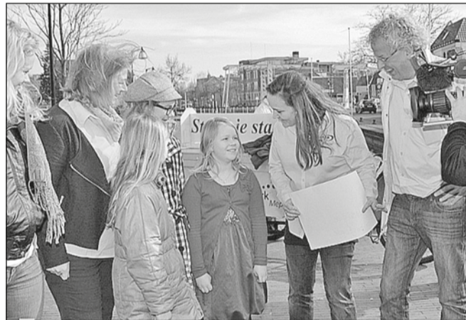
Bij de prijsuitreiking aan Musique Fantastique maakte de NPO tv-opnamen voor het programma Een Vandaag voor een item over lokale partijen.

Neem vooral een kijkje op de website www.musiquefantastique.nl , waar o.m. prinsessen- en elfenkostuums kunnen worden gekocht.