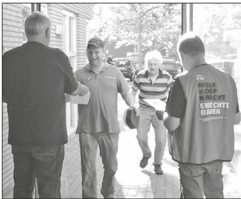
Medewerkers van Reestmond voeren een flyer-actie om aandacht voor de cao-onderhandelingen te vragen.

Medewerkers met een arbeidshandicap zijn niet te benijden. Door de Participatiewet mogen er vanaf begin dit jaar geen nieuwe mensen meer instromen bij de sociale werkplaatsen en de mensen die er nu werken moeten zoveel mogelijk bij reguliere werkgevers terecht komen. Het is dus maar de vraag hoe hun toekomst eruit ziet. Daarnaast liggen de cao-onderhandelingen al ruim twee jaar stil.