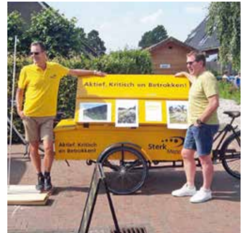
De opbouw bij de braderie Nijeveen is met de bakfiets een fluitje van een cent.